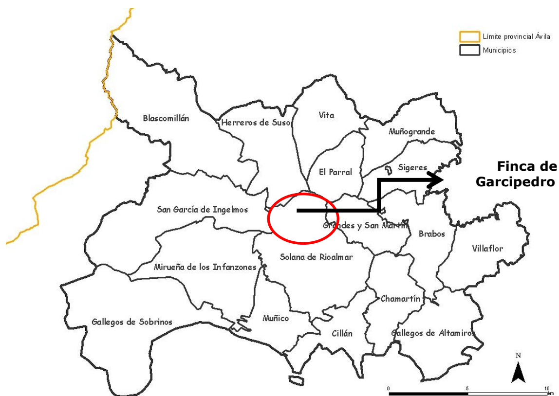
Figura 1: Municipios del ámbito de actuación

El ámbito de actuación del programa está compuesto por 17 municipios de la provincia de Ávila que se sitúan en torno a la "finca de Garcipetro" , propiedad de la Fundación Tatiana Pérez de Guzmán el Bueno y ubicada en el municipio de Solana de Rioalmar.