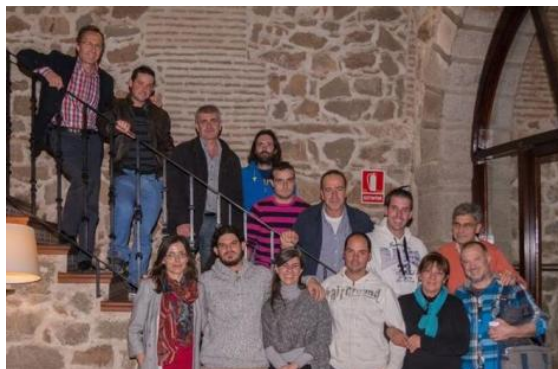
Segunda edición del curso Dirección de Proyectos: bases para la competencia. Noviembre 2015

Dando continuidad a las actividades incluidas en el Programa, en el mes de noviembre se pone en marcha la segunda edición del curso "Dirección de Proyectos: bases para la competencia", incluido en esta segunda convocatoria del Programa. El objetivo de este curso es proporcionar las claves fundamentales para la formulación de las iniciativas de emprendimiento según la metodología del grupo de investigación. Como resultado, los emprendedores elaborarán un informe de emprendimiento