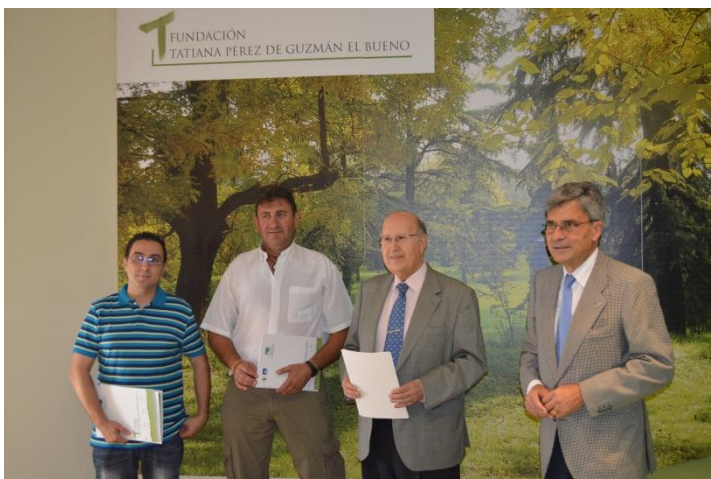
Firma del acuerdo de colaboración y compromiso en la sede que la Fundación Tatiana tiene en Madrid. Entrega de la ayuda a fondo perdido para los proyectos Farmaolé y Agrovit

En julio de 2015, se entrega la financiación a los dos primeros proyectos aprobados por medio de la firma de un "Acuerdo de colaboración y compromiso". El primer proyecto que recibe financiación es un proyecto de innovación en apero agrícola, para mejorar el laboreo. El segundo proyecto, consiste en la creación de una farmacia online para la venta de productos de parafarmacia y cosmética de laboratorios españoles.