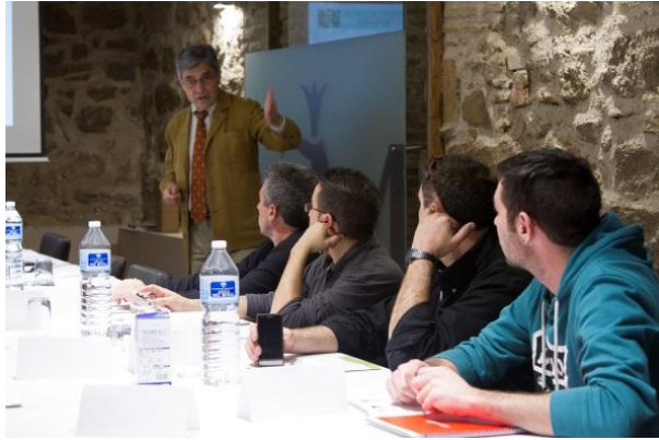
Primera edición del curso de Dirección de Proyectos: bases para la competencia, en Ávila, marzo de 2015

Este curso es de aplicación transversal a todas las áreas temáticas de los proyectos. En este bloque, además de facilitar conocimientos acerca de la dirección y gestión de proyectos empresariales y de las competencias asociadas, se establecerán las bases para definir la relación de asesoramiento y acompañamiento a lo largo del proyecto.