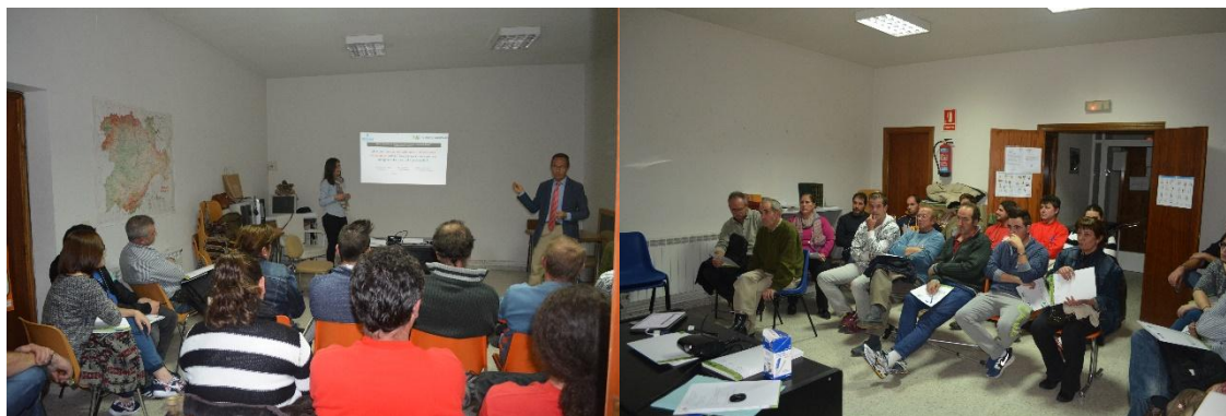
Segunda convocatoria de emprendedores. Solana de Rioalmar, octubre 2015.

En el mes de octubre se convocaron tres nuevos talleres participativos, uno en el mes de octubre de 2015; y otros dos más en el mes de noviembre con aquellos emprendedores y empresarios que no pudieron participar en la primera convocatoria del Programa y que estarían interesados en participar esta vez. Los talleres tuvieron lugar en los municipios de Solana de Rioalmar y Vita, y en ellos se explicaron las actividades llevadas a cabo durante la primera convocatoria, las nuevas condiciones aprobadas por la Fundación Tatiana, en cuanto a temas de financiación y los cursos incluidos en el Plan de Capacitación y pasos necesarios para solicitar la financiación.