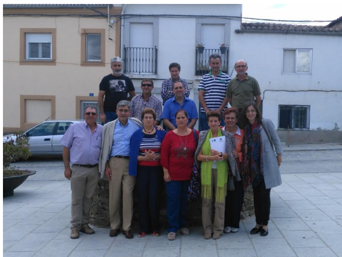
Reunión con los alcaldes de los municipios JESTeR el día 29 de septiembre de 2015 en Solana de Rioalmar

Durante la reunión se explicaron las distintas actividades llevadas a cabo durante estos meses, el Plan de Formación y Capacitación incluido en el Programa, las condiciones de financiación aprobadas hasta el momento y los primeros proyectos aprobados a fecha 13 de julio de 2015. Desde el grupo Gesplan se hizo especial hincapié en que el apoyo de los alcaldes, como líderes locales, es fundamental para el éxito del Programa y para animar a la población a participar en la búsqueda de ideas para los nuevos proyectos dinamizadores.