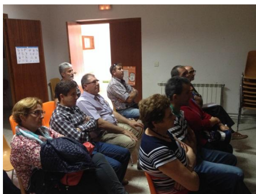
Reunión con los alcaldes de los 17 municipios en Solana de Rioalmar el día 29 de septiembre de 2015

Con motivo del lanzamiento de la segunda convocatoria de proyectos del Programa JESTeR, el grupo de investigación Gesplan convocó a los alcaldes de los diecisiete municipios a una reunión, que tuvo lugar en el Ayuntamiento de Solana de Rioalmar el día 29 de septiembre de 2015. El principal objetivo de la reunión fue compartir experiencias e impresiones de los resultados obtenidos en el primer año de trabajo, y por otro lado, dar a conocer los pasos que se llevarían a cabo en los meses venideros. A esta reunión acudieron los alcaldes de los municipios de Brabos, Cillán, Gallegos de Altamiro, Mirueña de los Infanzones, Muñico, Sigeres, Solana de Rioalmar, Villafior y uno de los ediles de Vita.