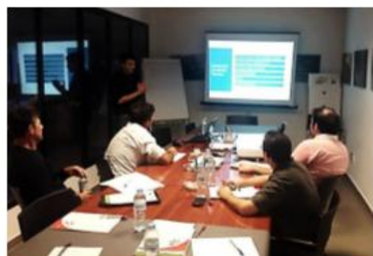
Curso “Contabilidad y elaboración de un Plan de Negocio” en SAT 9994 Camposeven, San Pedro del Pinatar, los días 11 y 12 de junio de 2015