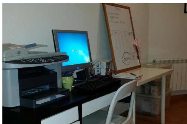
De Izquierda a derecha y de arriba a abajo: Demostración proyecto Agrovit; parcela de Futuro colmenar Miel Candelas; comederos para gallinas criadas en libertad Proyecto Gaenli; Oficina proyecto Farmalé